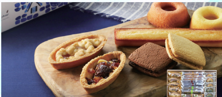
名古屋ふらんす ル・キャドー 27個入り

フランスのトップ・ショコラティエ『ミッシェル・ブラン』のマカロン。肉厚でもっちりとしたマカロン生地と風味豊かなクリームがフランスの情感あふれる濃厚な味わいをお届けいたします。