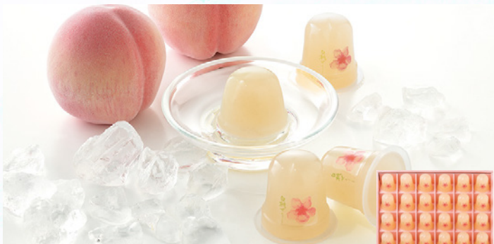
桃花亭 プチ完熟白桃ゼリー 30個入

パティシエが一つ一つ丁寧に焼き上げた、フランス伝統的焼菓子の詰合せ。シェ・コーベのスペシャリテ、マドレーヌをはじめとした可愛らしくも奥深い焼菓子を、素材を選び抜いて熟練の技術で仕上げたオリジナル・アソートギフトです。