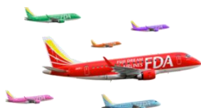
フジドリームエアラインズ (FDA)