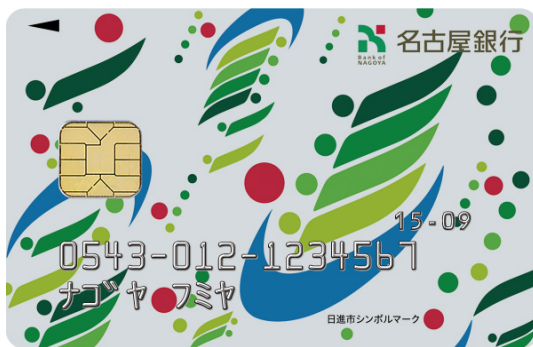
（日進市シンボルマーク）