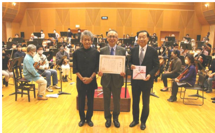
＜名古屋フィルハーモニー交響楽団への贈呈式の様子＞