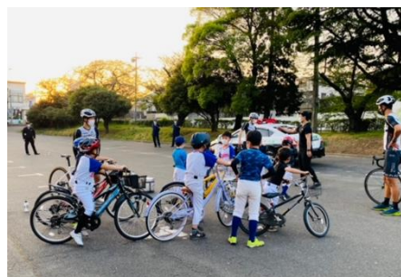
<自転車交通安全教室の様子>