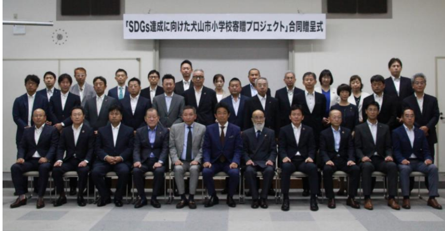
< 合同贈呈式の様子 >