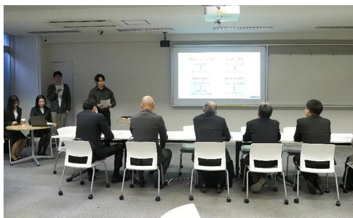
発表を行う中京大学の学生たち