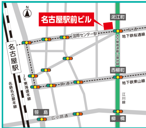
< 周辺地図 >