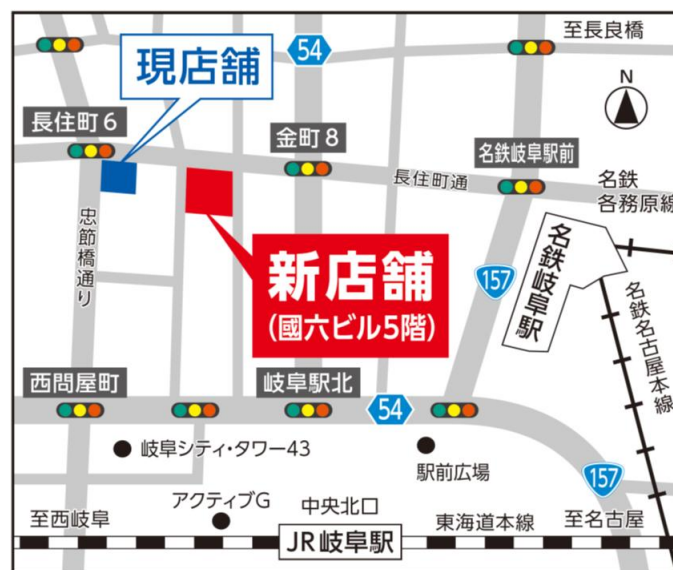
(岐阜支店 周辺地図)