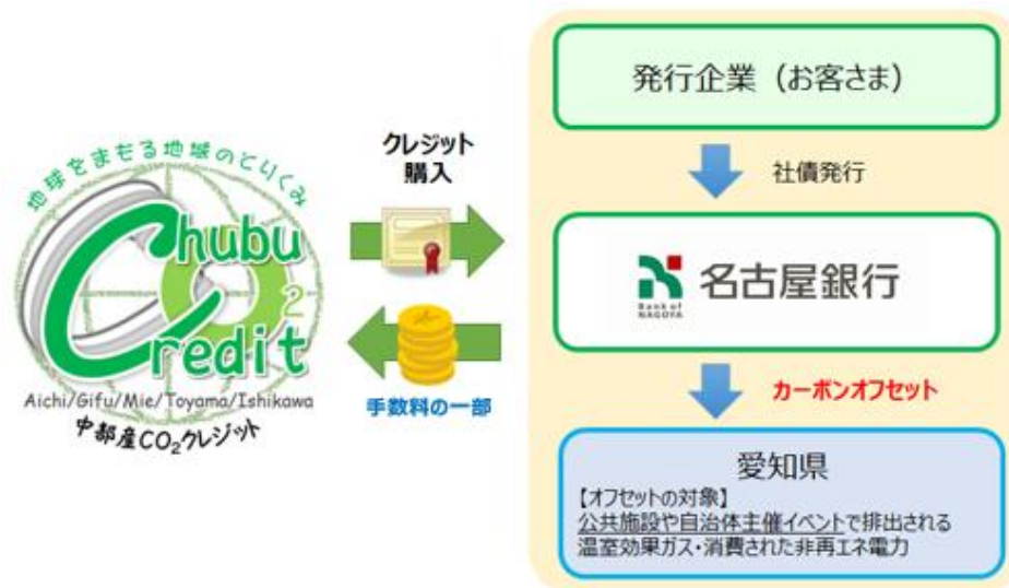
愛知県とのスキーム

https://www.meigin.com/release/files/20230914shibosai_cabon_offset.pdf