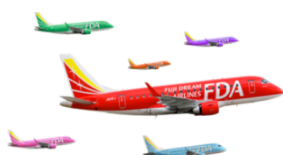
フジドリームエアラインズ (FDA)