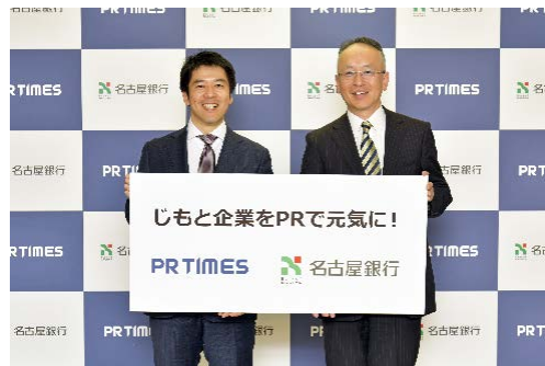
株式会社 PR TIMES