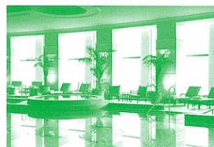
フィットネスクラブ