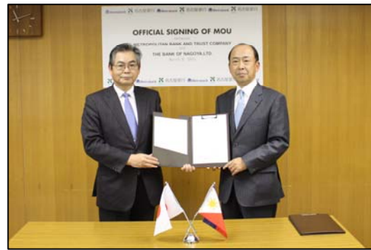
（業務提携覚書締結の様子）