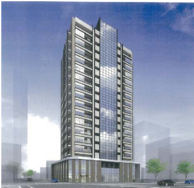
<移転先ビルの完成予想図>